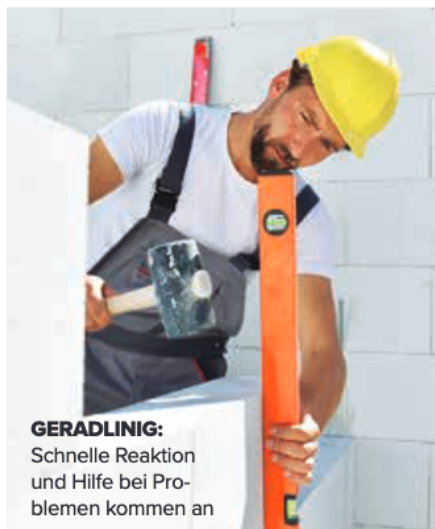
GERADLINIG: Schnelle Reaktion und Hilfe bei Problemen kommen an

Der Kundenservice bleibt eine Schwachstelle der Branche – bei allen Merkmalen sind gut 20 Prozent der Kunden nicht ganz zufrieden. Kulanz bei Reklamationen zeigen aus Kundensicht Kern-Haus und Baumeister-Haus, kostengünstige Hilfestellung bei Problemen liefern Eco System Haus und Helma, während Arge-Haus und Viebrockhaus mit schneller und zuverlässiger Reaktion punkten.