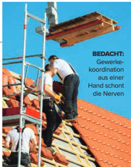
BEDACHT: Gewerkekoordination aus einer Hand schont die Nerven

alphabetische Sortierung; Quelle: ServiceValue